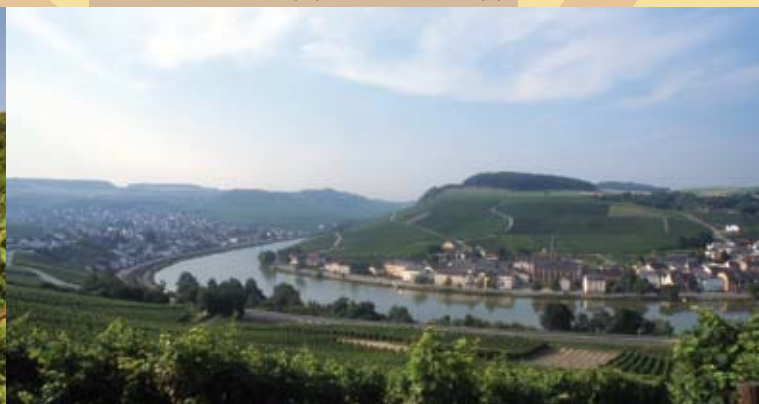
Obermosel: Nittel (D) und Machtum (L)

Les vins de la vallée de la Moselle, du Gris de Toul français au Riesling des versants escarpés allemands en passant par le Crémant de Luxembourg, sont le reflet de cette richesse culturelle qui s'appuie sur des procédés vitivinicols et un encépagement traditionnels. Des vins d'une même origine, issus de trois pays différents : unique en Europe.