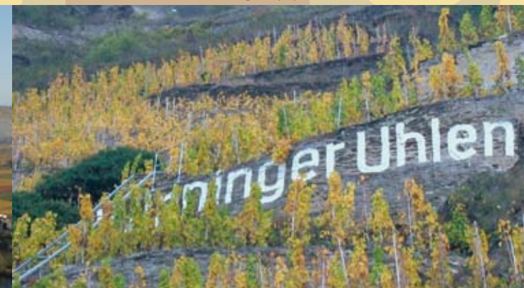
Terrassenmosel: Winingen (D)

Vous trouverez des informations complémentaires et une possibilité de prise de contact sous www.terroirmoselle.eu .