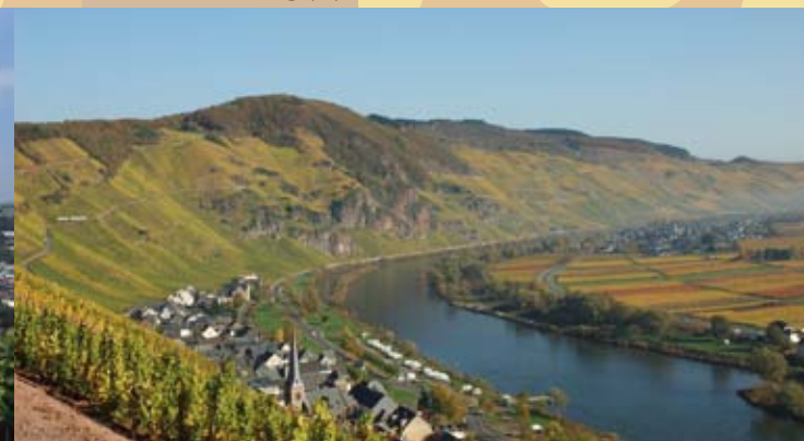
Mittelmosel: Ürzig (D)

Unter www.terroirmoselle.eu finden Sie weitere Informationen und eine direkte Möglichkeit, mit uns Kontakt aufzunehmen.