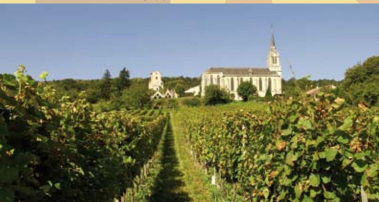
Côtes de Toul: Bruley (F)

Spiegel dieses Reichtums sind die Weine des Moseltals, die vom französischen Gris de Toul über den Crémant de Luxembourg bis zum Riesling der deutschen Schiefersteillagen eine unglaubliche Vielfalt bieten, die auf traditionellen Rebsorten, Anbaumethoden und Herstellungsweisen gründet. Weine aus drei verschiedenen Ländern, aber mit gemeinsamer Herkunft: einmalig in Europa.